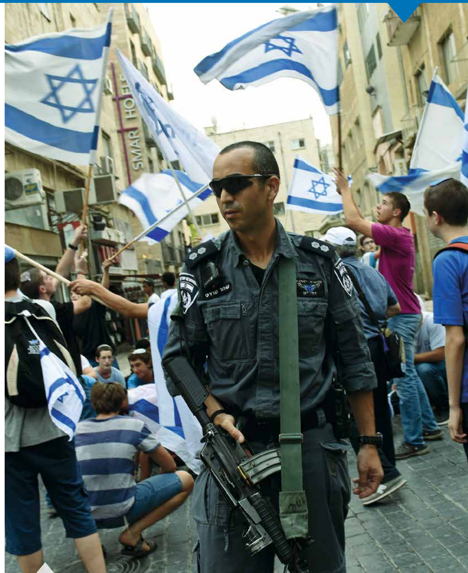
Die israelische Polizei patrouilliert im Oktober im Zentrum Jerusalems, um arabische Messerattacken gegen Israelis zu verhindern.