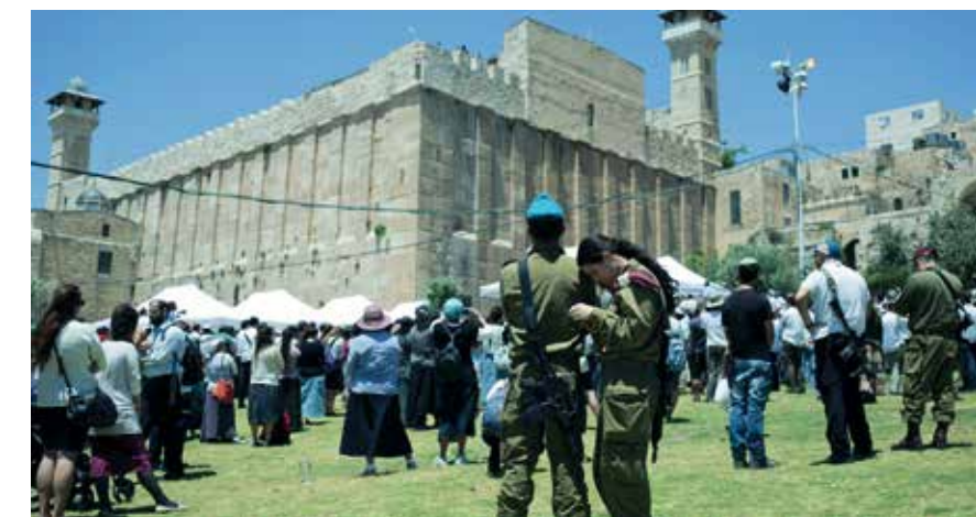
Jüdische Siedler und israelische Soldaten am Grab der Patriarchen in Hebron.

In der Resolution wollte die UNESCO ursprünglich den Platz vor der Klagemauer in „Al Buraq Plaza“ umbenennen und ihn zu einem „Teil der Al-Aqsa-Moschee bzw. des Bezirks Haram al-Sharif“ erklären, doch sie zog die Klausel nach Protesten der Vereinigten Staaten und anderer zurück, wie die Jerusalem Post berichtet.