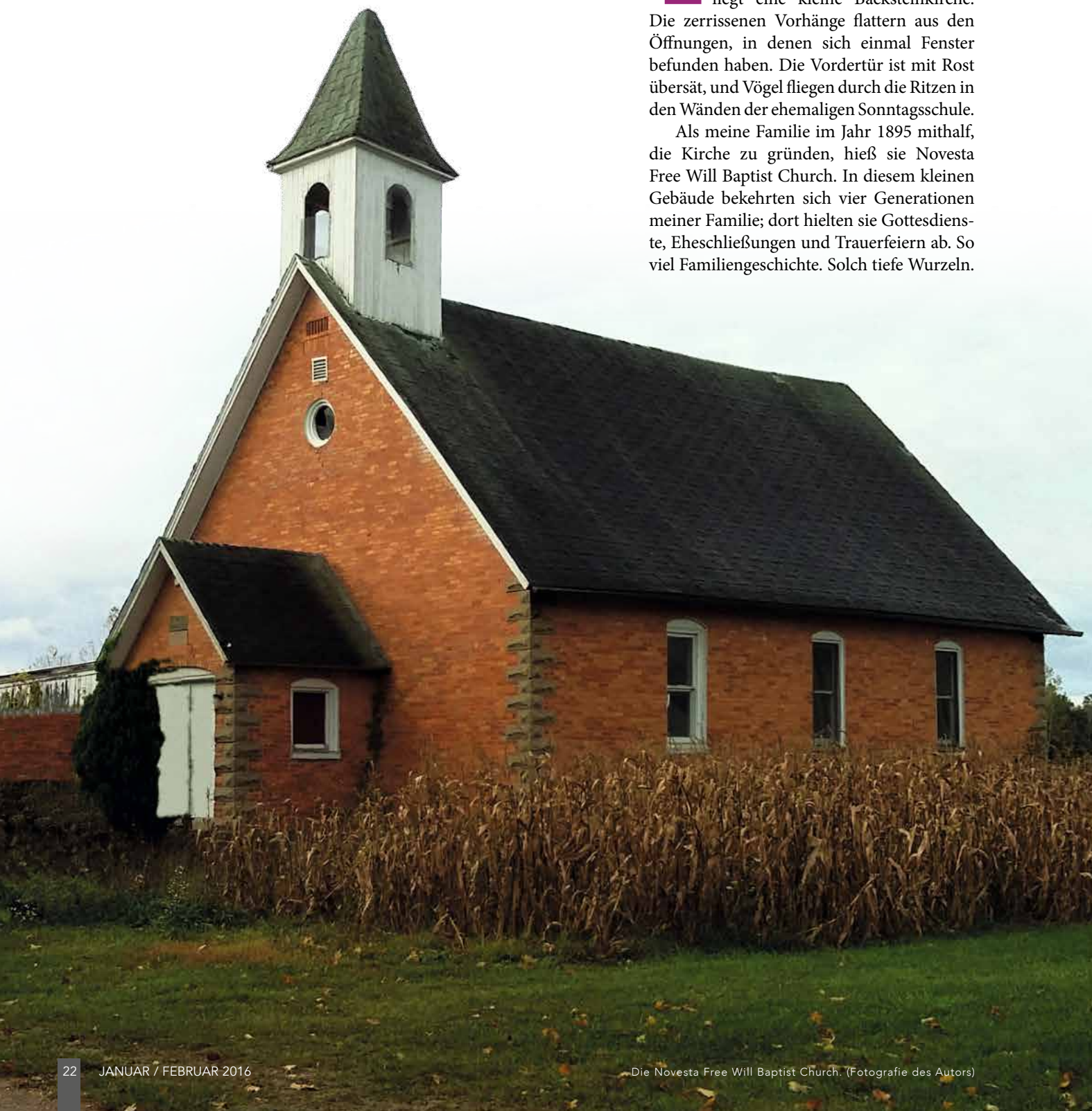
Die Novesta Free Will Baptist Church.

Als meine Familie im Jahr 1895 mithalf, die Kirche zu gründen, hieß sie Novesta Free Will Baptist Church. In diesem kleinen Gebäude bekehrten sich vier Generationen meiner Familie; dort hielten sie Gottesdienste, Eheschließungen und Trauerfeiern ab. So viel Familiengeschichte. Solch tiefe Wurzeln.