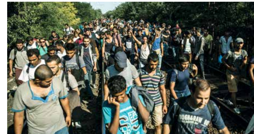
Menschenmassen auf der Flucht vor dem IS, die im September in Ungarn die Eisenbahngleise entlang liefen. Sie kamen aus Afrika und dem Nahen Osten in der Hoffnung, Länder wie Deutschland und Schweden zu erreichen.

Von Raymond Ibrahim (RaymondIbrahim.com)